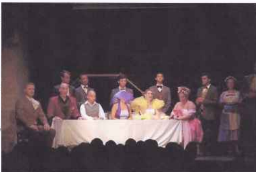
Les chanteuses et chanteurs de La Cenerentola (Cendrillon).

La salle était comble hier soir à la Citadelle Vauban de Palais pour la première de La Cenerentola (Cendrillon) de Rossini avec une distribution internationale